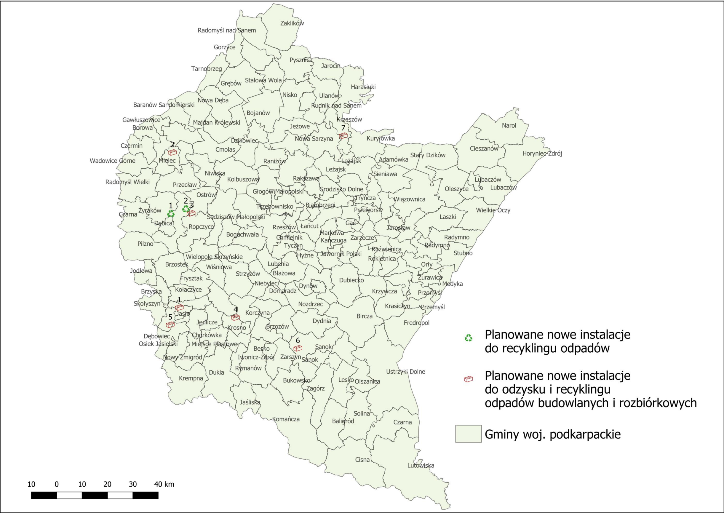
Planowane nowe instalacje do recyklingu odpadów oraz do odzysku i recyklingu odpadów budowlanych i rozbiórkowych