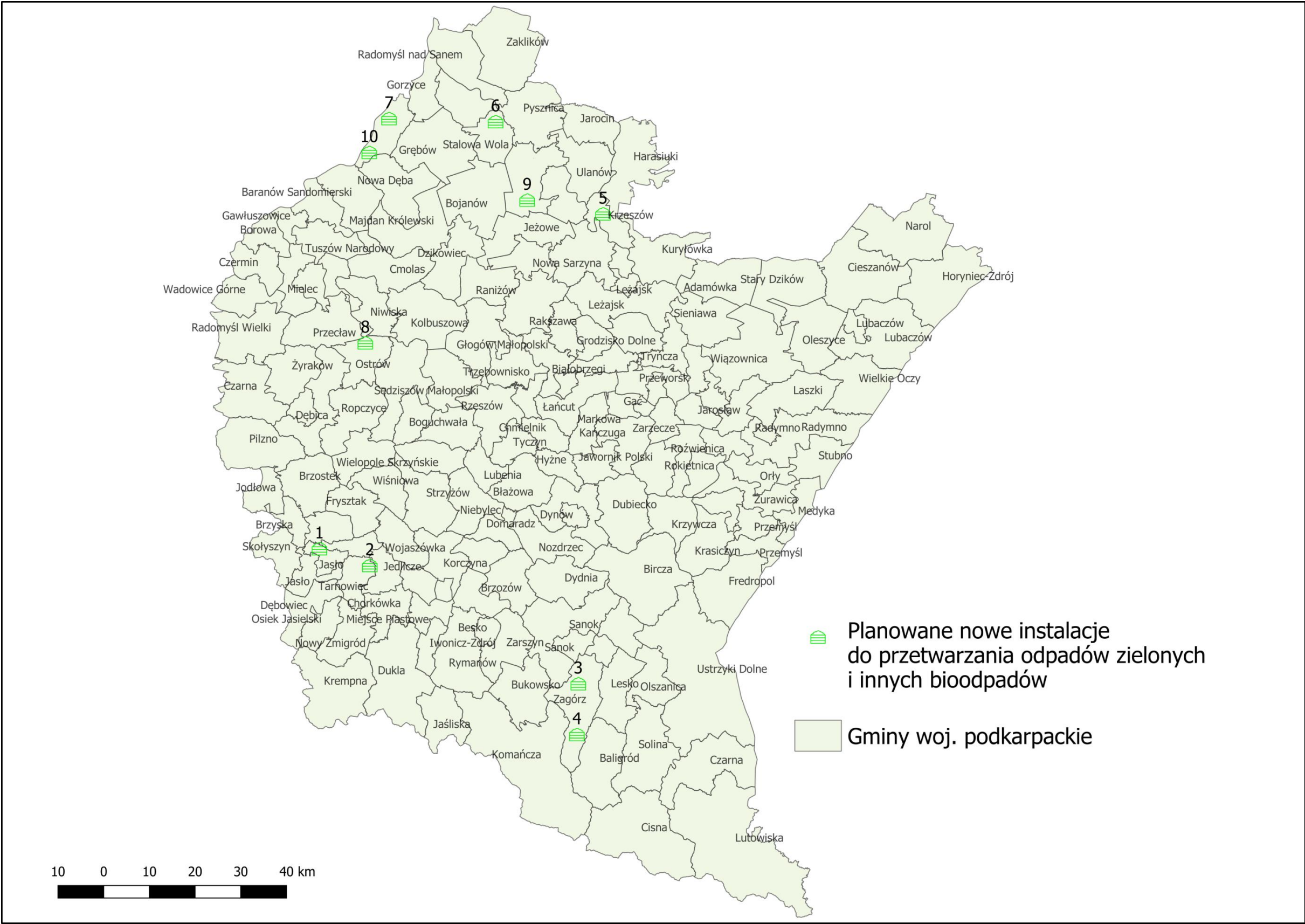
Rysunek 2 Planowane nowe instalacje do przetwarzania odpadów zielonych i innych bioodpadów