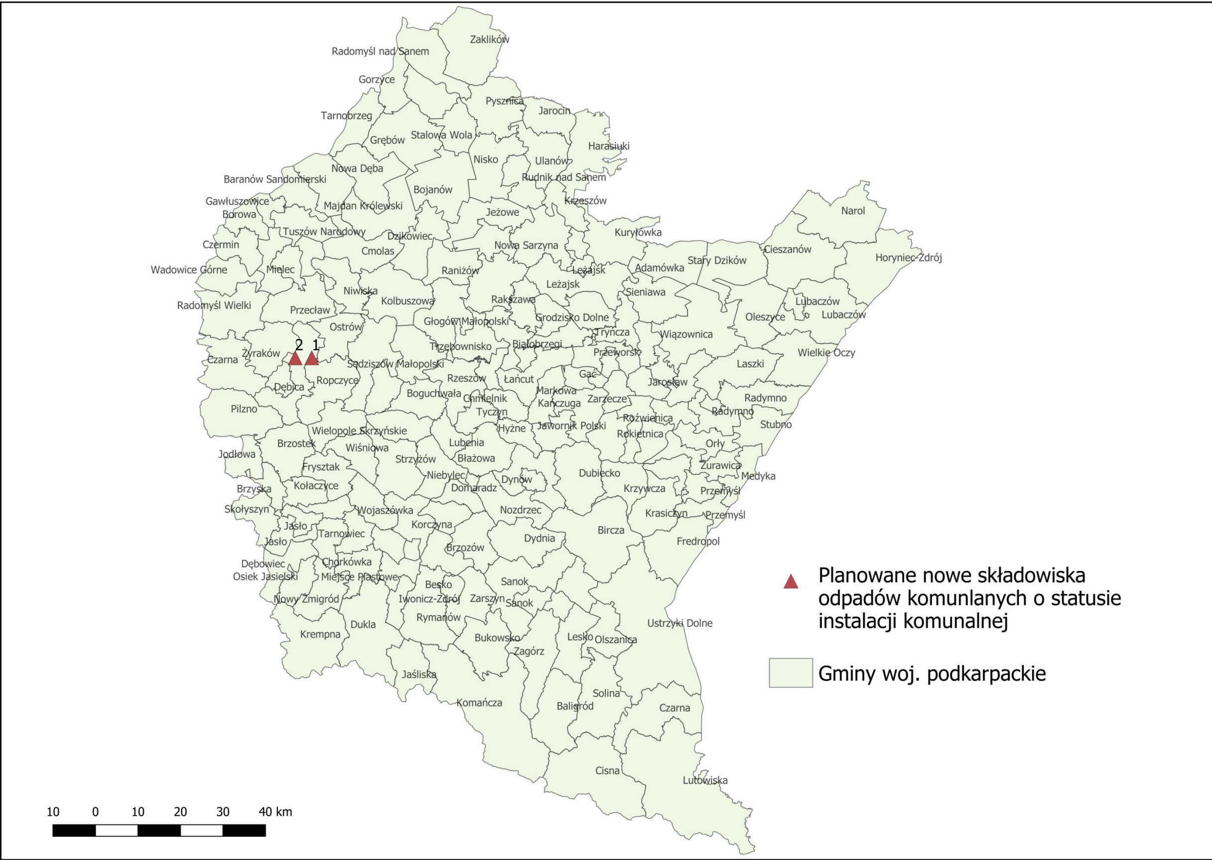
Planowane nowe składowiska odpadów komunalnych o statusie instalacji komunalnej