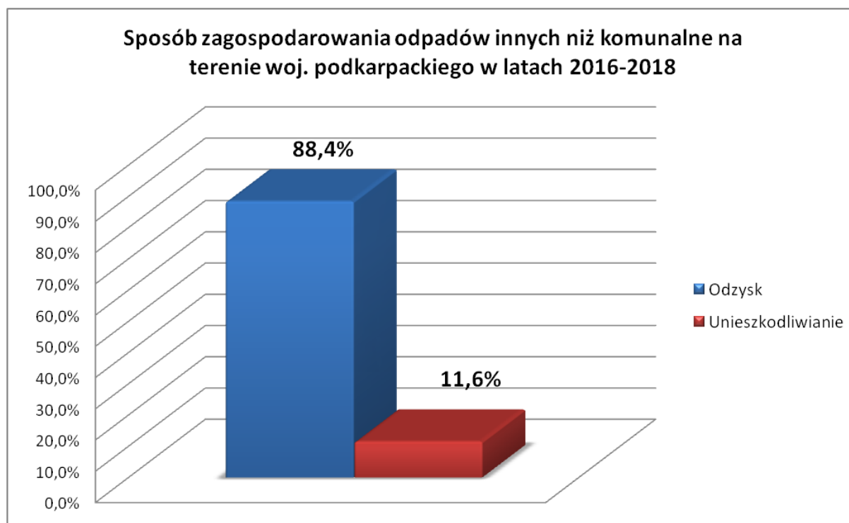
Rysunek 1: Sposób zagospodarowania odpadów innych niż komunalne na terenie województwa podkarpackiego, w latach 2016-2018.

Źródło: Opracowanie własne na podstawie danych WSO.